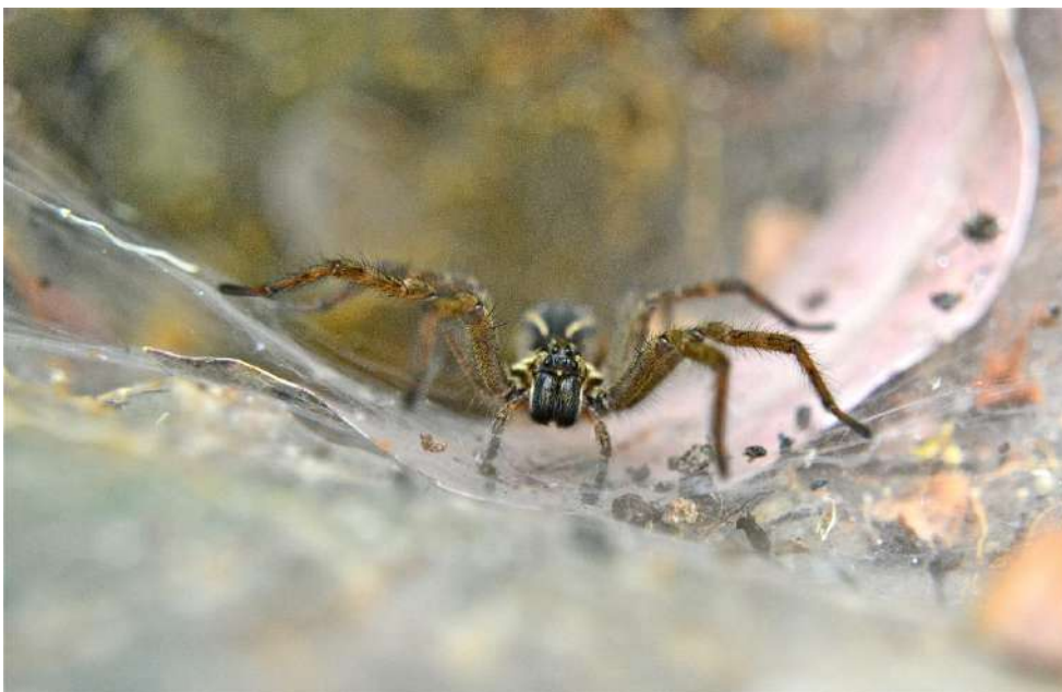
Aglaoctenus lagotis

Após o término da sessão, pediremos aos apresentadores que retirem seus pôsters, pois teremos novas apresentações de pôsters no dia seguinte.