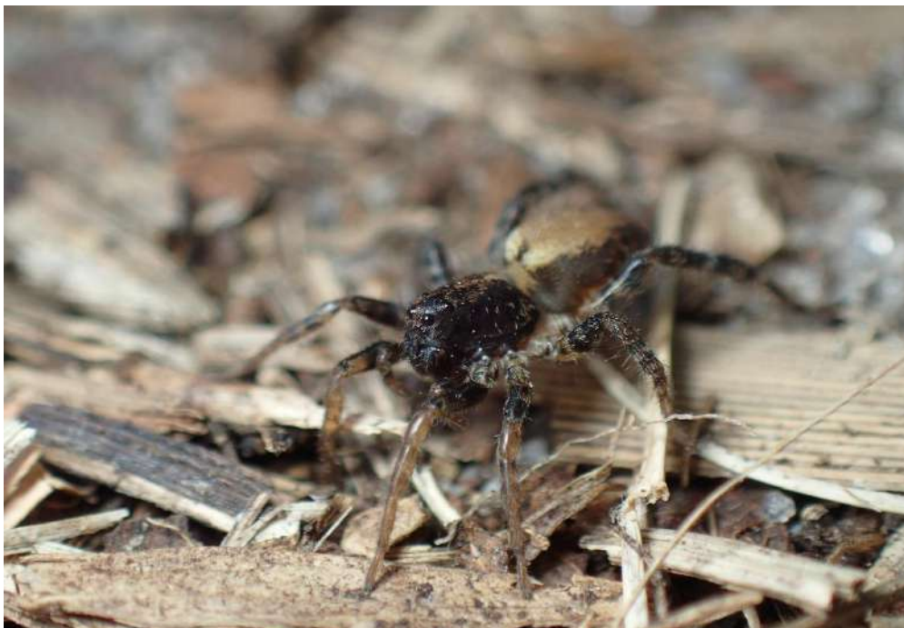
Abaycosa nanica

Nosso evento conta com o apoio institucional do IIBCE (MEC), Facultad de Ciencias (UdelaR) e Sociedad Zoológica del Uruguay. ISA, PEDECIBA (Uruguai), CSIC (UDELAR, Uruguai), e INIA financiaram o evento. Presidencia de la República, Ministerio de Educación y Cultura, Ministerio de Ganadería, Agricultura y Pesca, Ministerio de Ambiente e Ministerio de Salud Pública, declararam este evento de Interesse Nacional. Temos também o prazer de anunciar uma colaboração com a revista PeerJ. Estas revistas patrocinarão o Concurso de Estudantes. Temos também o apoio da Quality Print e da Calcar. A adega Bodega Pablo Fallabrino patrocinará a pré-estreia do documentário 'Unexpected beauty through the eyes of explorers of the tiny world' da De La Raiz Films.