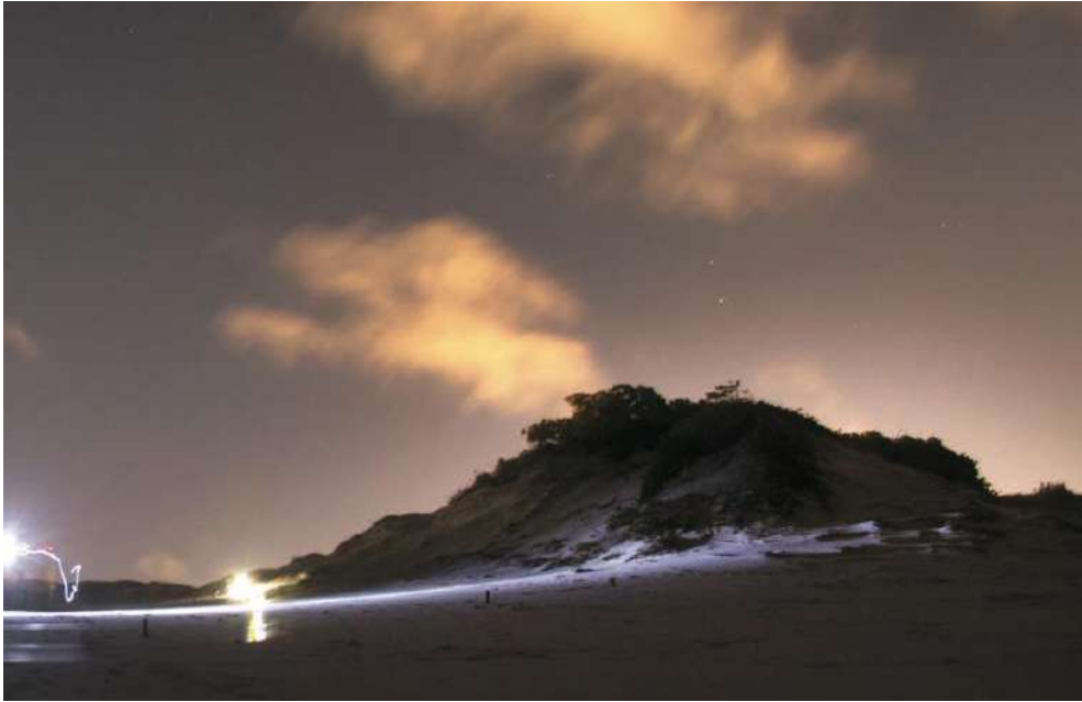
Coletando em Salvador da Bahia, Brasil