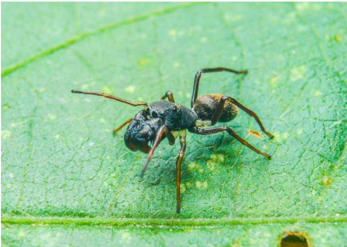
Sarinda marcosi

Todos os estudantes que apresentarem seus trabalhos como primeiros autores em apresentações orais ou em pôsteres participarão automaticamente do concurso de apresentação de estudantes. Um painel composto de especialistas reconhecidos de diversas nacionalidades e gêneros avaliará suas apresentações. Por este motivo, durante as sessões de pôsteres, estudantes devem estar perto de seus pôsteres para discutir o estudo e responder perguntas durante toda a sessão.