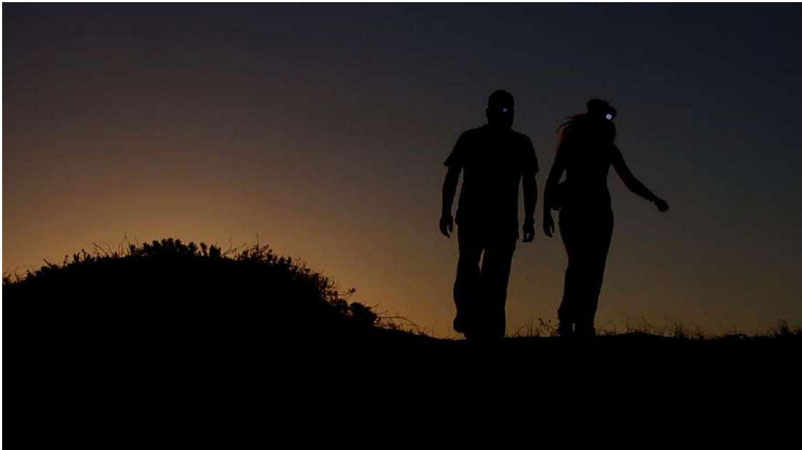
Exploradores noturnos

Prontamente trabalharemos com os pares mentor-estudante de acordo com cada disciplina e entraremos em contato com eles por e-mail. Nosso objetivo é que cada estudante e mentor se encontrem durante o congresso e passem um almoço juntos para discutir idéias, projetos, possibilidades de bolsas, e pedir conselhos, em tópicos relacionados à Aracnologia.